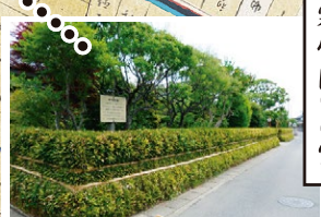
江戸時代から続く伝統の寒竹囲い、別名籠甲斐とも呼ばれています。7月に行われる天王祭前に生垣の締め直しを行います。