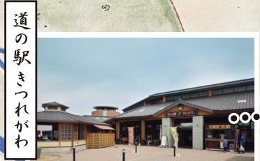
地域の新鮮野菜や特産品販売、飲食も充実。日本三大美肌の湯『きつれがわ温泉』を楽しまれます。無料足湯あり。