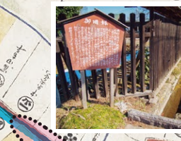
御用堀 江戸時代に作られた五石堀みが見られます