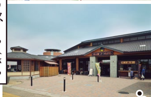
道の駅きつれがわ 地域の新鮮野菜や特産品販売、飲食も充実。日本三大美肌の湯「きつれがわ温泉」を楽しめます。無料足湯あり。