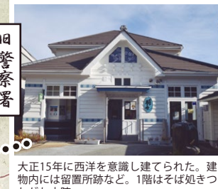
旧警察署 大正15年に西洋を意識して建てられた。建物内には留置所跡など。1階はそば処きつれがわ本陣。

江戸時代からかわらぬ街路と屋敷割、御用堀や寒竹圍いの家などの江戸風情を感じる景観。足利家由来の古刹、明治期のモダンな建築など、喜連川は見どころいろいろ。往時を偲んで、そして美味しいものを探して、ぜひ散策してみてください。