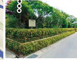
寒竹圍いの家 江戸時代から続く伝統の寒竹圍い。別名籠甲垣とも呼ばれています。7月に行われる天王祭前に生垣の締め直しを行います。