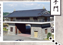
喜連川神社 中世末氏の屋敷跡 立派な大手門が目を引く