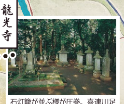
龍光寺 石灯籠が並ぶ様が圧巻。喜連川足利家歴代藩主の墓所があります。