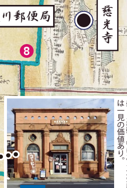
旧喜連川郵便局 大正2年に建てられたロマンを感じる建物中にある金庫庫は目の保養あり。